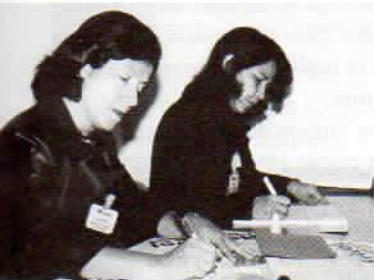
Por causa do sucesso, há fila de espera para as próximas turmas.

Segundo a Chefe da Divisão de Formação e Qualifi-