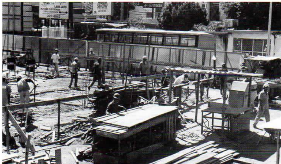
Operários e técnicos trabalham com afinco para cumprir os prazos.