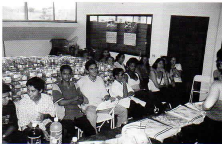
O trabalho foi realizado em clima de alegria.