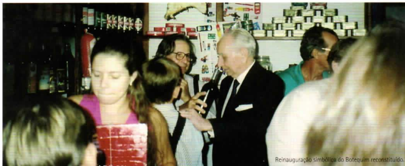
Reinauguração simbólica do Botequim reconstituído.

20 anos trabalhando a educação como instrumento de transformação social e cidadania