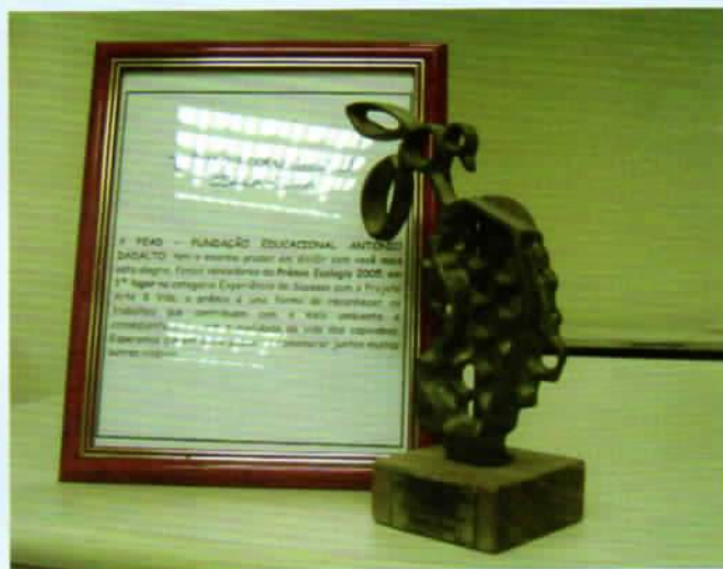
FEAD 1º Lugar: Prêmio Ecologia 2005

Comemorar conquistas é importante. Nestes 20 anos, a Fundação Educacional Antônio Dadalto (FEAD) tem se orgulhado dos resultados e conquistas alcançados e trabalha com o otimismo suas ações futuras.