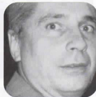
Abílio Corrêa Prefeito/Castelo

Foi, sem dúvida, uma semana inesquecível: o trajeto que eu tinha que seguir até o local; a preparação, muitas vezes improvisadas, dos locais de realização das aulas; a participação de cada educando durante as aulas... Cada detalhe foi relevante e importante durante o processo. Como participante ativo do Projeto, senti-me realizado por cumprir o meu ofício. Como Cidadão, tive a oportunidade de perceber que podemos construir um mundo melhor, menos desigual e mais justo. A diferença está em nossas atitudes.