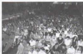
Festa de certificação, que reuniu mais de 1.200 pessoas, em uma bela cerimônia.