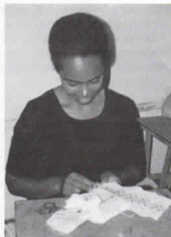
Aluna do Curso de Artesanato, aprendendo a técnica de bordado e ponto cruz.